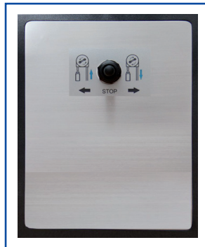
Bedienschalter Pumpe (Saugen/Stop /Freiblasen)