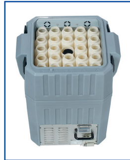
Aktive Kühlbox 12/115/230 V Ausführung 24 x 1 L