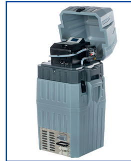
Mit Dosiersystem Schlauchpumpe